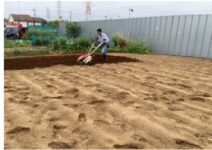
4月下旬耕運機により畑を耕す