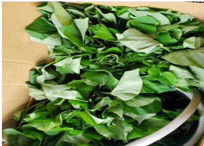
4月中旬さつま芋の苗木購入