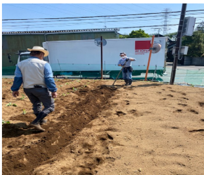
4月下旬苗木を植えるうねを作る