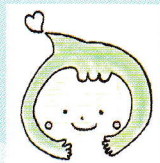
都筑区青少年指導員連絡協議会 イメージキャラクター「つづきキズナ」