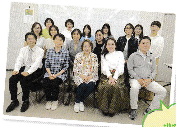
地域の 子育て応援団!

私たち主任児童委員は、子どもや子育てに関する支援を専門に担当する民生委員・児童委員です。相談内容に応じて、その地域を担当する民生委員・児童委員や行政機関、学校、児童相談所などと連携し、地域の身近な相談相手として子どもや子育てに関する支援活動を行っています。