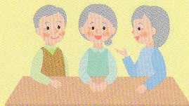
サロン・居場所づくり