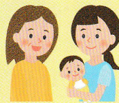
子育て・子ども支援