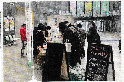
都筑野菜販売の様子

他にも「5年後、都筑区がどんな街になってほしいか」のアンケートを取りました。一部抜粋