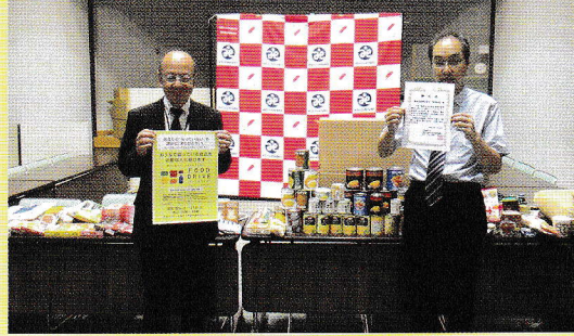
阪急阪神百貨店 都筑阪急様