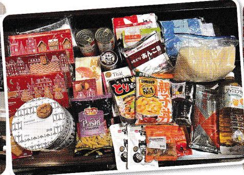
各世帯にお渡しした食料品セット(例)