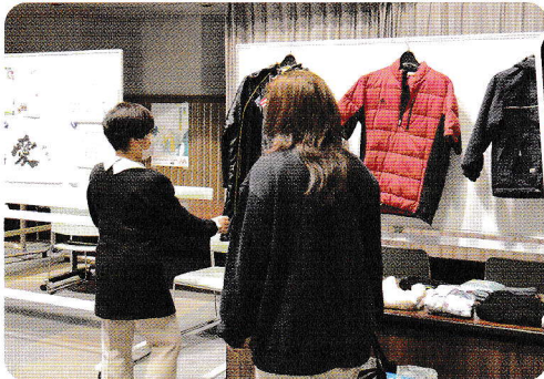
お渡し会当日の様子