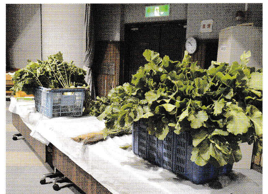
地域の方からいただいたお野菜