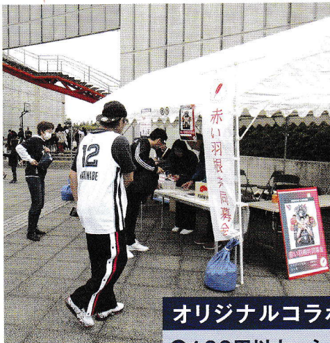
区民Dayでの募金活動の様子

今年度も横浜ビー・コルセアーズ 区民Dayにお伺いさせていただき、募金活動を行いました。当日は、日本ボーイスカウト横浜第132団ボーイ隊様にご協力いただき、募金活動を実施しました。募金額に応じて、横浜ビー・コルセアーズ様と神奈川県共同募金会都筑区支会とのオリジナルコラボグッズをお渡しさせていただきました。試合前2時間で、85,892円のご協力をいただくことができました。