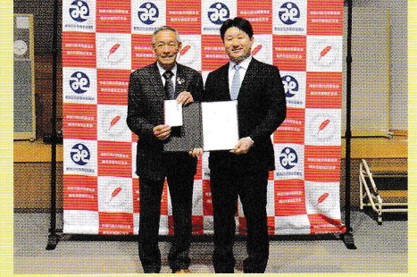
ヤマザキ製パン従業員組合 神奈川支部様